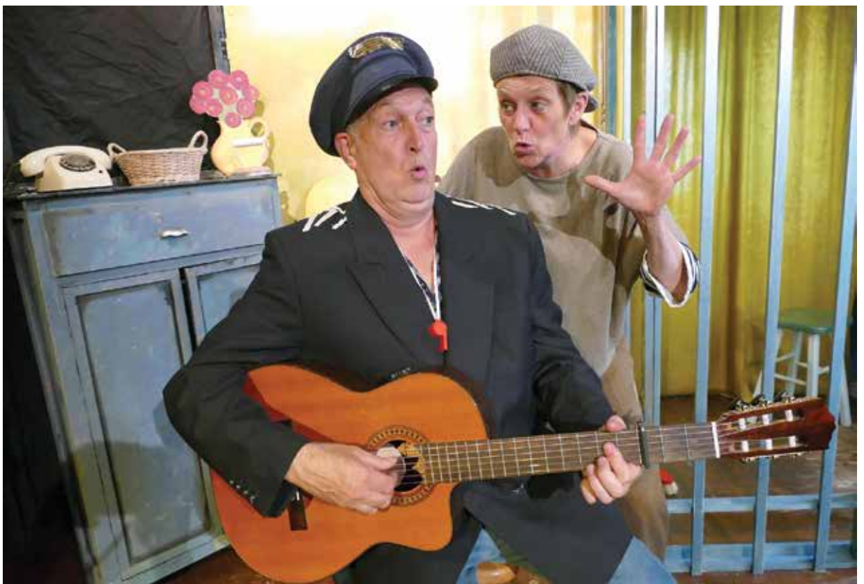
Agent en Boef in de voorstelling 'Boevenstreken'